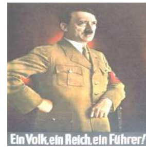
أدولف هتلر (1889-1945م)

موضوع مقالي: 2 ظهر في ألمانيا بين الحربين الاولى و الثانية نظام ديكتاتوري،تميز بعدة خصائص .